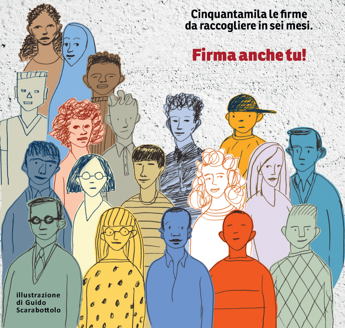
illustrazione di Guido Scarabottolo